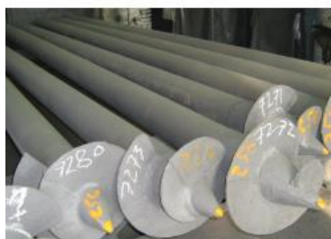
Рис.1 Сваи типа СВЛ

Вывод: Сметные нормы определены из расчета диаметра ствола свай , а не диаметра лопасти. Поэтому в технической части Сборника 05. Свайные работы, опускные колодцы, закрепление грунтов не может быть никаких поправочных коэффициентов.